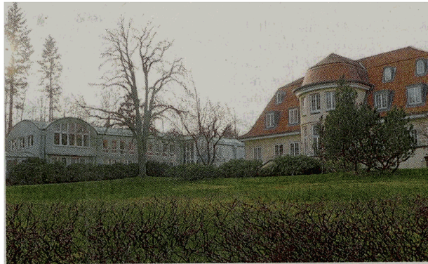
Im Kupferhof und dem dazugehörigen Neubau will der Förderverein „Hände für Kinder“ das Kurzzeitwohnen realisieren.